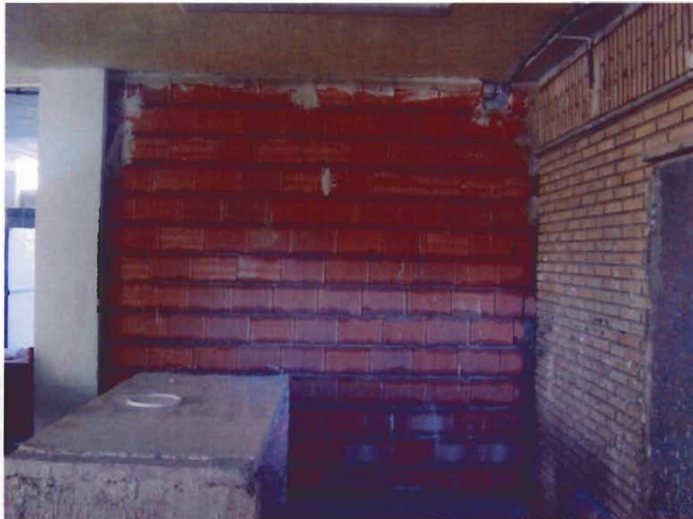
Tabique de Termoarcilla de 14

Tabique de ladrillo Termoarcilla de 14 cms de espesor con enlucido de yeso a las dos caras de 1,5 cms de espesor aproximado. Espesor total 17 cms. Aislamiento a ruido aéreo 46 dB. Peso aproximado 160 kg/m 2 .