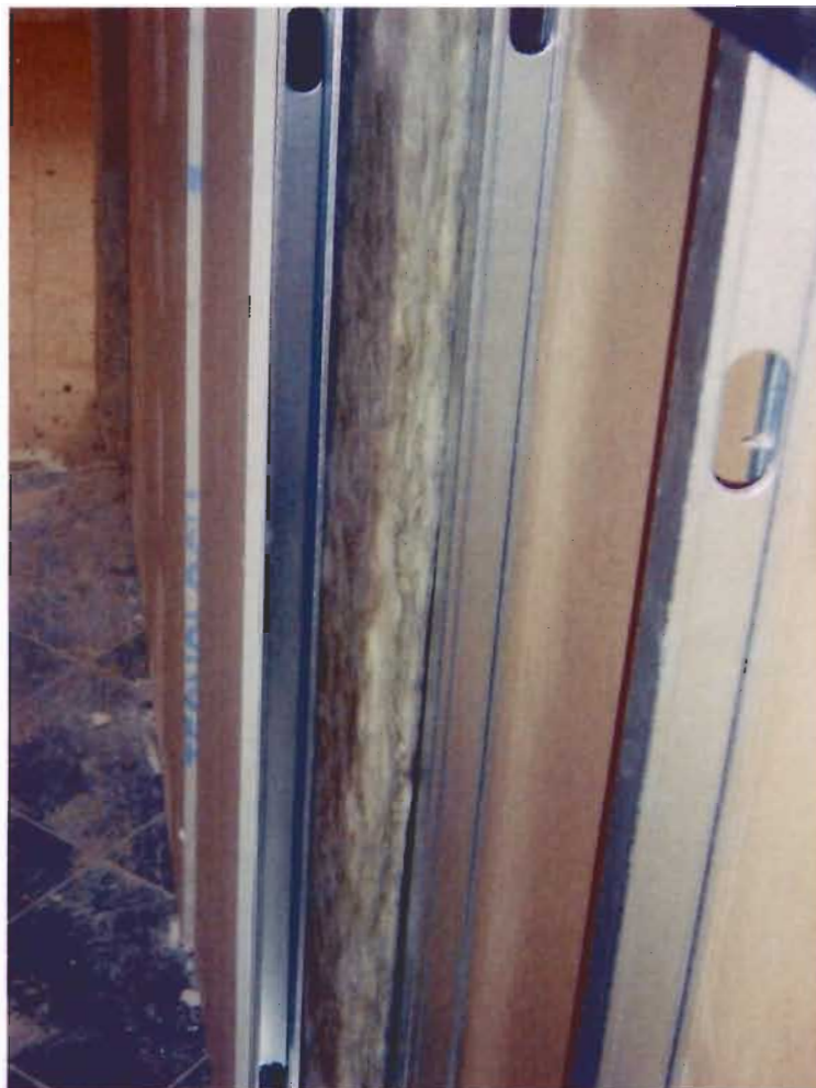
Detalle montaje sistema de placas de yeso

Formado por dos placas de cartón – yeso de 15 mm de espesor atornilladas a una estructura de chapa galvanizada de 48 mm de espesor formada por canal superior e inferior y montantes verticales colocados cada 40 cms, cámara de aire de 30 mm con aislamiento intermedio de Panel Arena de 40 mm, otra estructura igual a la anterior sobre la que se atornillan otras dos placas de cartón – yeso de 15 mm. Espesor total 18,60 cms. Aislamiento a ruido aéreo 54 dB. Peso aproximado 46 kg/m 2 .