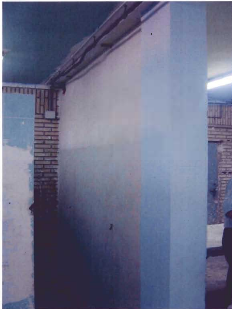
Vista general del tabique finalizado