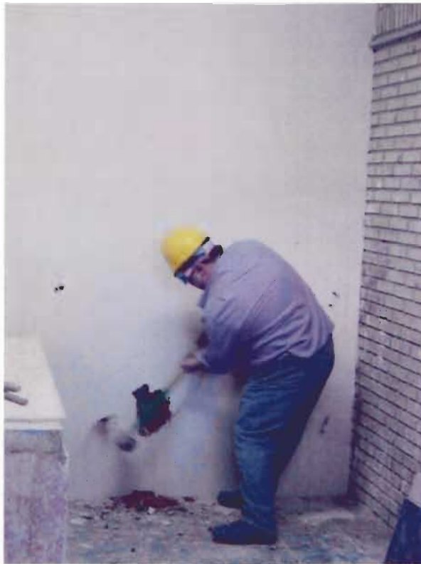
Comienzo demolición tabique de termoarcilla

La prueba se realizó el 25 de abril de 2006 con la presencia del Notario D. José Luis de Miguel Fernández y consistió en realizar un agujero en cada uno de los tabiques del tamaño necesario para que una persona acceda al otro lado del mismo. La prueba la realizó un operario con ayuda de un mazo de 6 kg