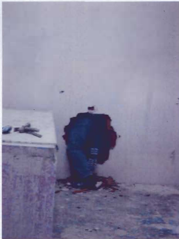
Operario atravesando el tabique de termoarcilla