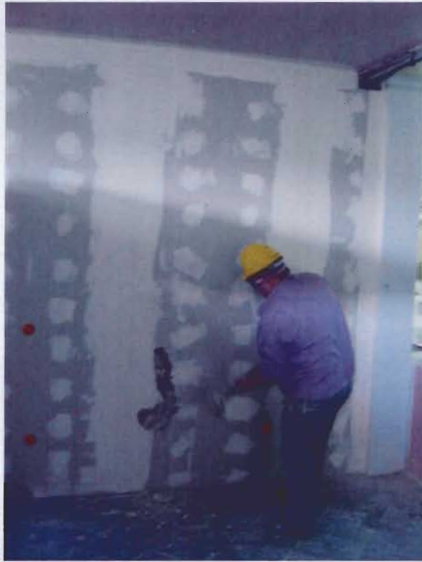
Comienzo demolición tabique de placas de yeso