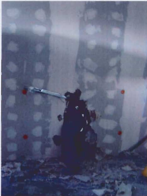
Operario atravesando el tabique de placas de yeso